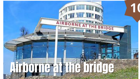
Airborne at the bridge