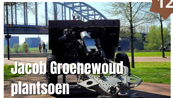
Jacob Groenewoud plantsoen